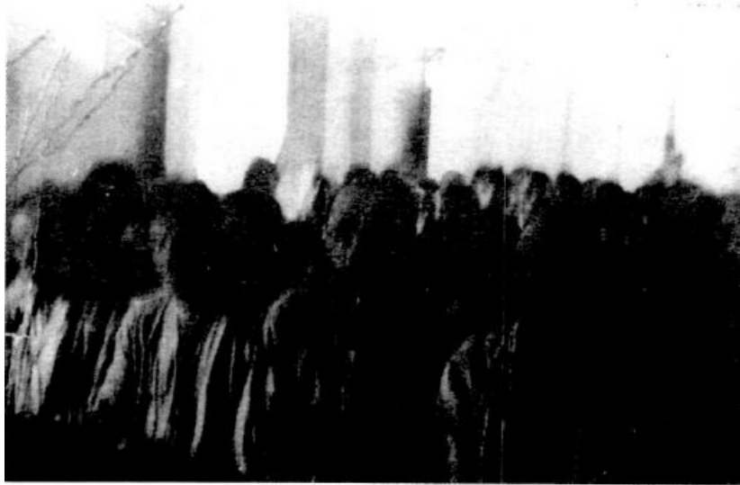
Foto de Espítitos, relatada no texto acima, inserida nesta edição. Local : Centro Espírita Fé e Humildade, Passa-Vinte, ( hoje Município de Palhoça ) na década de 1930.